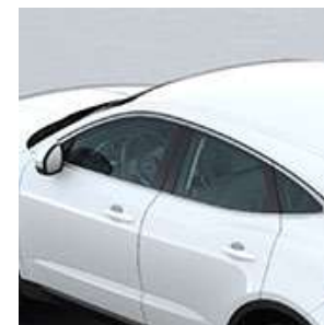
CORNICI DEI FINESTRINI